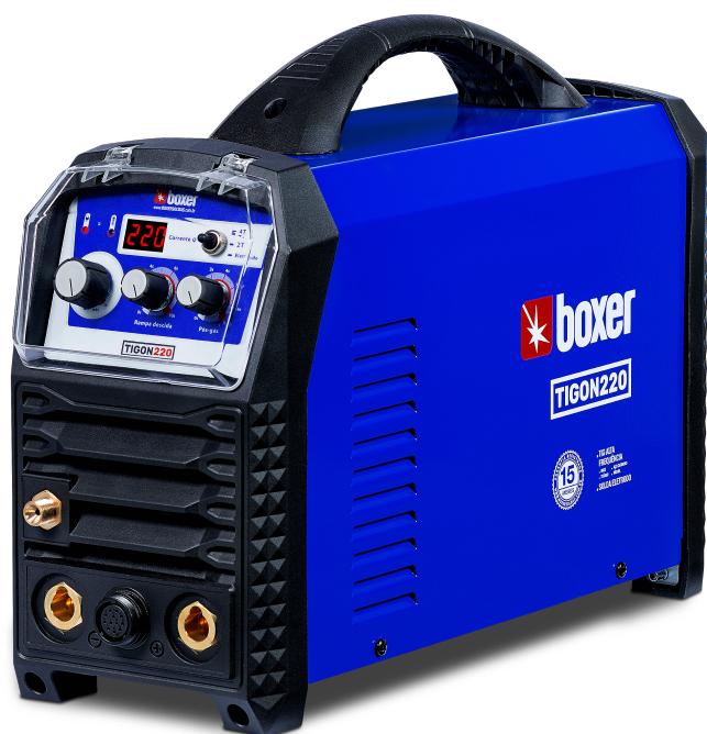
1 MÁQUINA TIGON 220V